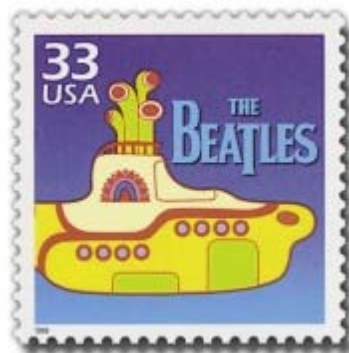
Ausschnitt eines legendären Platten-Covers der Beatles als Briefmarkenmotiv: Yellow Submarine (USA MiNr. 3185).