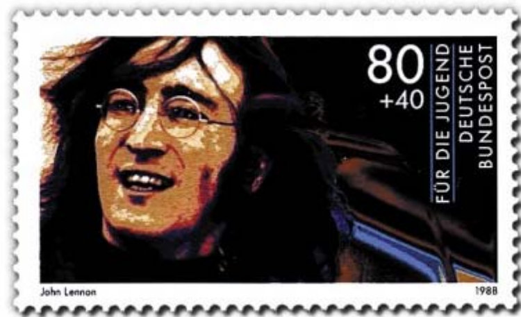
John Lennon auf einer bundesdeutschen Jugendmarke von 1988 (Bund MiNr. 1363)

John Lennon wurde am 9. Oktober 1940 in Liverpool geboren. Angeregt durch den aufkommenden Rock 'n' Roll, besonders von Elvis Presley, entwickelte sich sein Wunsch, selbst Rock 'n' Roll-Musiker zu werden. 1955 gründete er seine erste Band "The Quarry Men". Mit Paul McCartney, George Harrison und Ringo Starr bildete er ab 1962 die "Beatles". Mit "Penny Lane", "Yellow Submarine", "Hey Jude" und vielen anderen Titeln wurden die Musiker zur erfolgreichsten und einflussreichsten Band des 20. Jahrhunderts. Sie ist sogar auf Briefmarken verewigt. Auch nach der Auflösung der Gruppe 1970 war John Lennon als Musiker aktiv. Er wurde am 8. Dezember 1980 in New York erschossen.